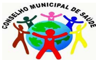
Barra do Rocha/ BA